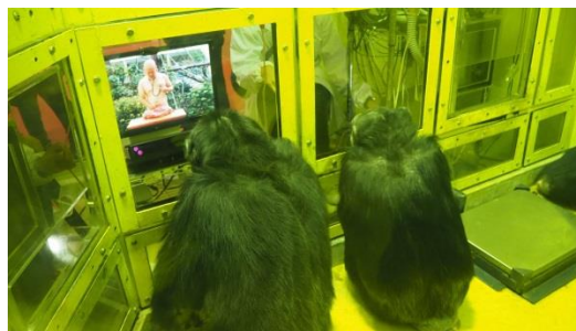
アイ・トラッカーによる実験の様子